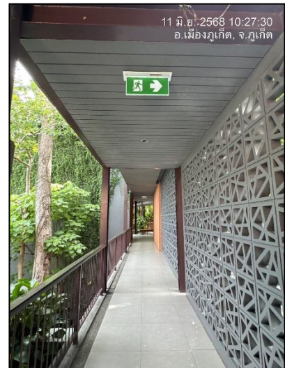
รูปภาพที่ 1.3 การใช้พื้นที่ของโครงการ